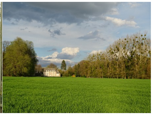
Une vue lointaine du château de l'Ouest