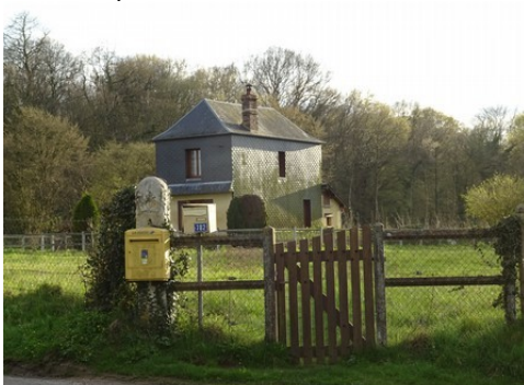
Une maison avec essentage en ardoises