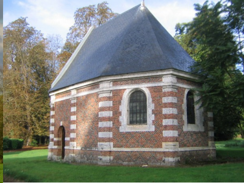
La chapelle du château