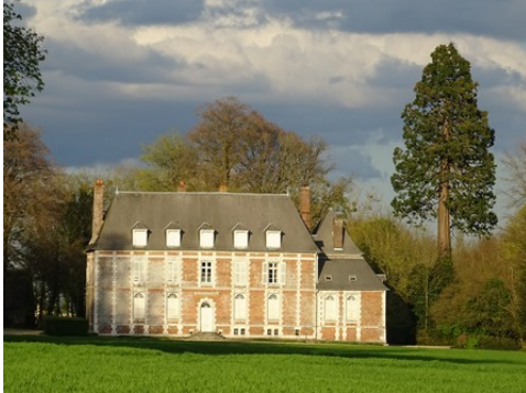
La façade ouest (vue proche)