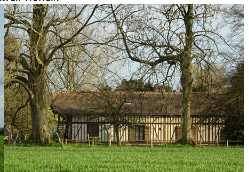
Une maison à pans de bois