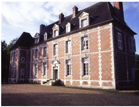
La façade est du château (vue proche)