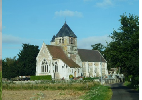
L'église de Bouquetot