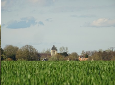
Le village de Bouquetot (vue lointaine)