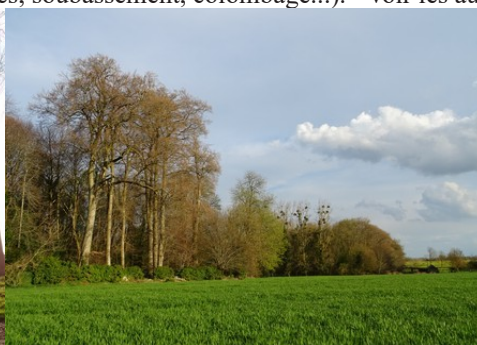
Le paysage de champs et de bois